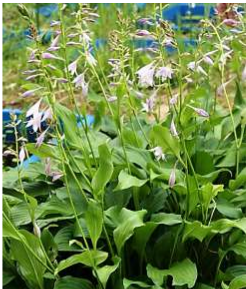
ギボウシの花が咲き 始めました。