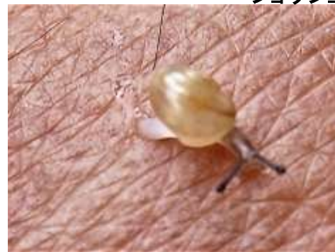
ヒダリマキマイマイの幼生だそうです。ほんの1.5mmほど。