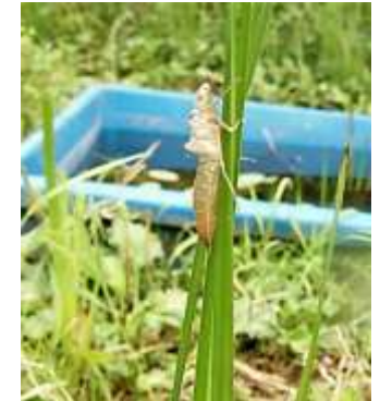
トンボ・ヤゴの羽化殻