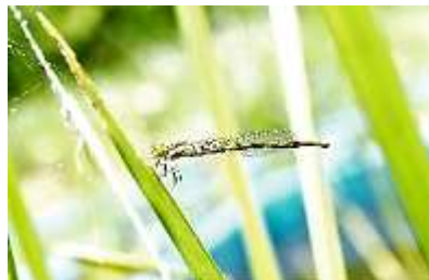
アオモンイトトンボの早とのことでした(互井さんによる)