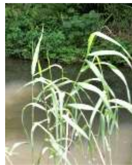
第二調整池の イネ科雑草