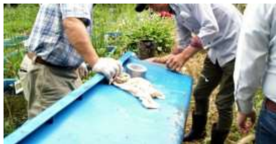
破損した水槽、水がもれないように念入りに補修します。