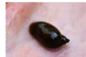
モノアラガイ だそうです