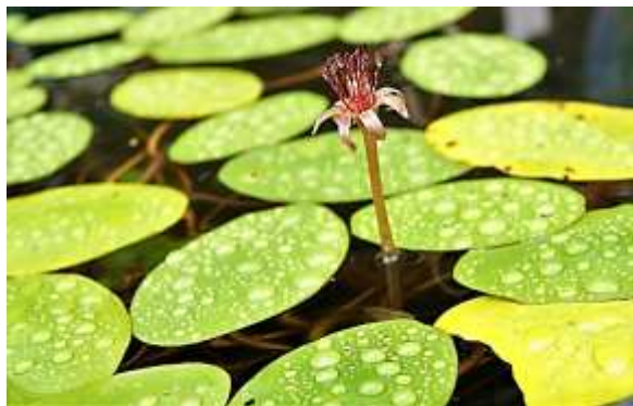
当日開花した唯一のジュンサイの花