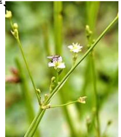
サジオモダカ:午後になると開花する