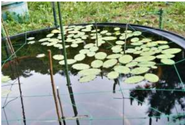
印旛沼産のジュンサイ: 葉数91枚(育成池への移植がまたれます)