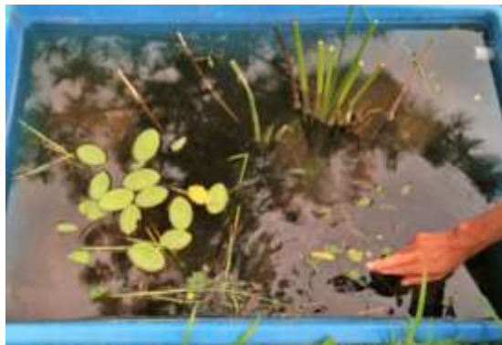
No12水槽:左の浮葉はジュンサイ(印 旆沼産)の小さな芽から成長しました。