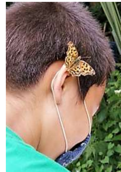
S君の耳飾り:キタテハ