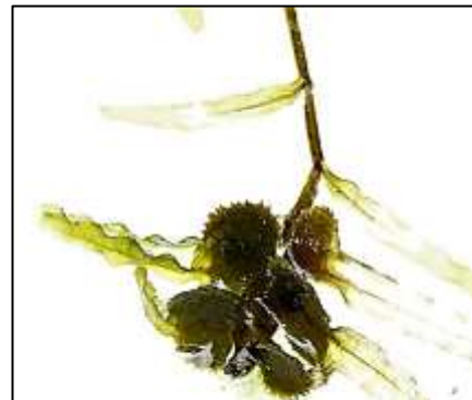
拡大したエビモの殖芽(硬い薄いプ ラスチック板の重なりのようなもの) で晩秋ころから発芽してくる)