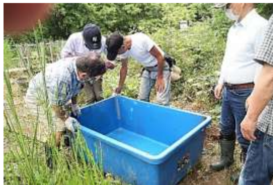
補修した水槽を埋めます。