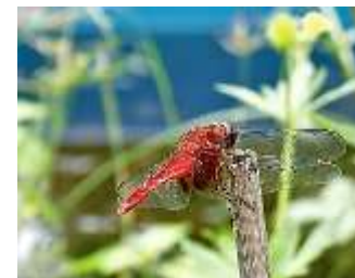
ショウジョウトンボ