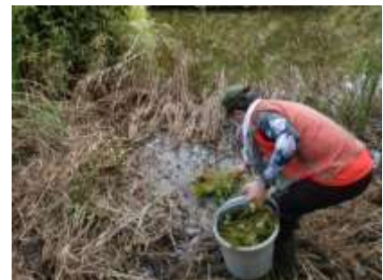
水槽で増えたトチカガミ、デンジソウの池への移植を試みました。今回はバケツに2杯分を、3か所に投入。