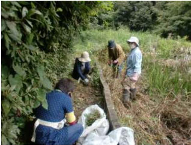
本池脇通路と本池内にも侵入したナガエツルノゲイトウ取りを中心に草刈り（上） ザリガニの水槽侵入を防ぐ為、水槽わきの溝掘り（下） 気持ちのよい気候になってきたとはいえ、体を動かしての作業で皆さん、汗だくです。