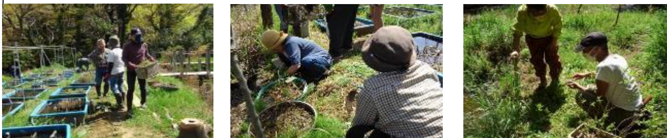
水槽周りに勢いよく生えてきた草をこまめに刈る（左・中）ヤナギの苗は第一調整池脇に植え付けた（右）