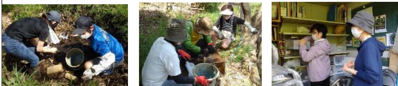
どろどろの小池内のザリガニ探し、2cm程度のザリガニがやはり多く潜んでいた（左）池に入れたザリガニ捕獲かごを確かめる（中）文具類、資料、図鑑類などや展示用パネル、折りたたみ椅子などを多くのものを収めた第二物置の整理整頓を推進（右）