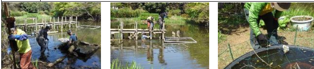
本池内に置いてあった筏が倒壊しており、危険なので引き揚げた（左）網を張った枠組みの移動も水中に入っの作業（中）水槽内に落ちた枯れ葉やごみなどを網を使って丁寧に掬う（右）