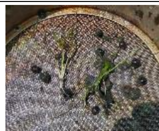
芽生えたオニバス種子（上） カエルの放流（下）