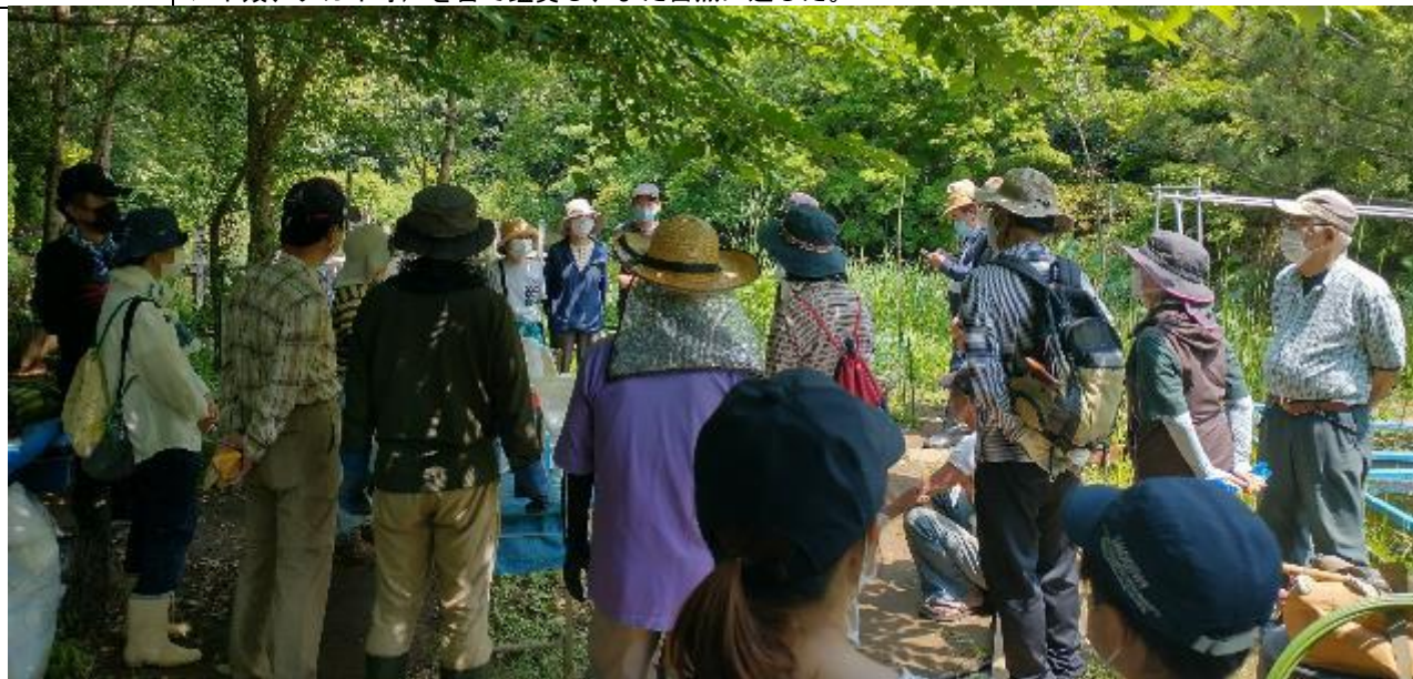
作業前のミーティング。本日行いたい作業内容を発表(上)参加者の皆さん、自分が行いたい作業を見つけて取り組みます。水槽内の水草の確認。(左下) 草刈り。(中央左下) 水路の整備。(中央右下) 生きもの探し。(右下)