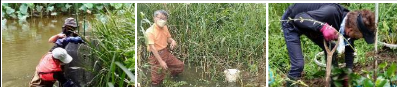
オニバス植え付けはザリガニとカメ対策が必須(左上) デンジソウ植え付け(中央上) ヒメコウホネ鉢替え(右上) 水槽周りの草刈り(左下) 第8水槽のデンジソウを除去(中央下) 貯水大型タンク設置のための地均し(右下)