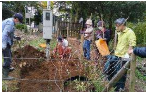
野草保護区の整備は、強すぎる雑草の根っこの掘り取り