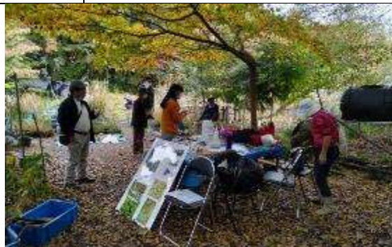
落ち葉が降りしきるなか、それぞれ深まる秋を感じての作業