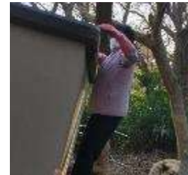
物置小屋の外回りの整理、不要物の処理に取り掛かる。（左、中央） 物置小屋の屋根の清掃を行う（右）