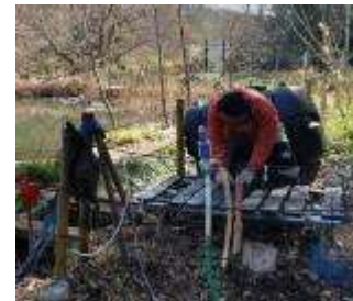
ザリガニ捕獲カゴの点検と設置。（左、中央） 大型貯水槽の設置。（右）