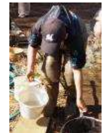
紅葉小路側外周のオカメザサの剪定（左） 育成池最終排水口の清掃（中央左） 水槽群の水草の芽生えの点検とアカウキクサの除去（中央右） 生きもの探し（右） 参加者の皆さんが、それぞれに生き活きと活動し、寒さの中にも関わらず、いい汗をかいておられた。今年もまた1年、それぞれが出来ることに取り組み、楽しく精を出して参りましょう！