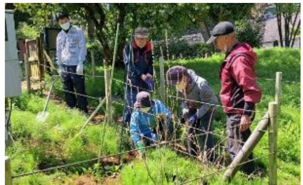
本池のジュンサイ育成囲いを広げる作業（左上） 水槽の手入れと草刈り（左下） 水路の整備のための土運び作業（右上） 野草保護地区内の整備（右下）