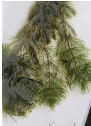
水槽7、ホザキノフサモ