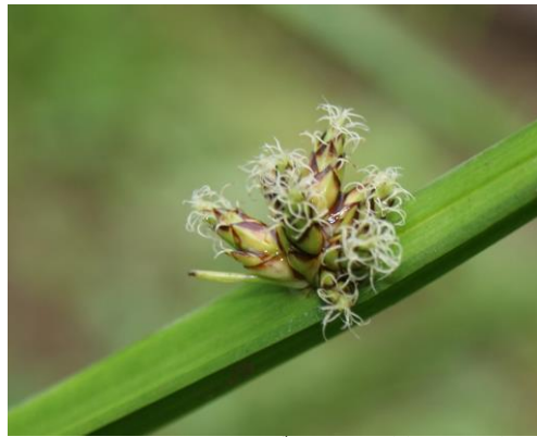
水槽2、カンガレイの花、3岐する白いめしべ柱頭が目立つ