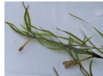
水槽10、ヤナギモ類（ヤナギモと比べると葉が細く小ぶり）