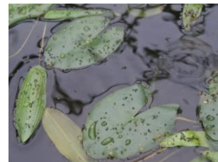
水槽15、ヒメコウホネ