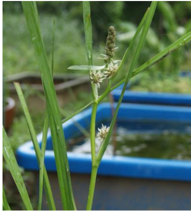
水槽1、オオミクリ雌花開花