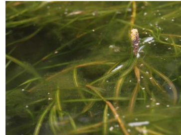
水槽6、ヤナギモの花序