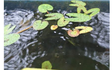
水槽7、オニバス（千葉緑化植物園より）成長とともに葉形が変化する）