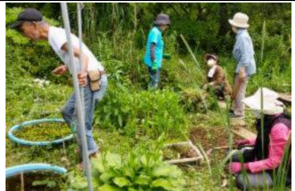
アオミドロ除去作業を終えてにこやかに歓談する皆さん(左上) 和気あいあい草刈り作業をする皆さん(右上)