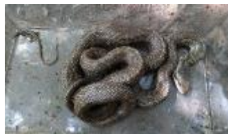
捕獲したザリガニの記録作業(左上) 完成した水タンクの試用(中央上) 水槽群の水草を調べる(右上) スタッフのビブスを付けて生きもの探しのS君と捕まったアオダイショウ(左)