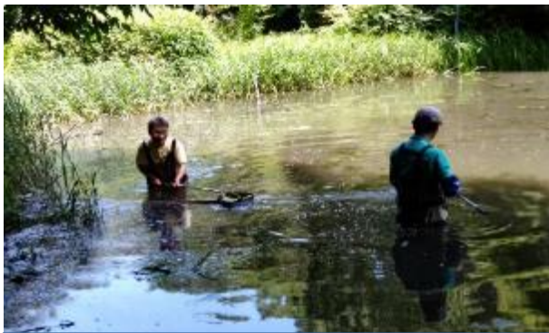
池に入ってアオミドロを除去