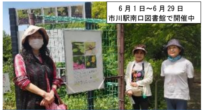
6月1日～6月29日 市川駅南口図書館で開催中