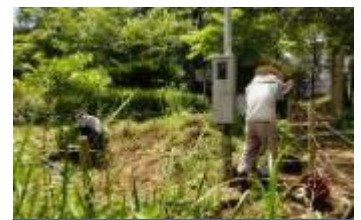
繁茂した草を刈り取る