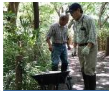
池の水調整の為土嚢を入れる