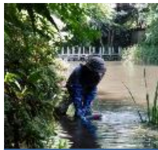
井戸吐水口から水を誘導