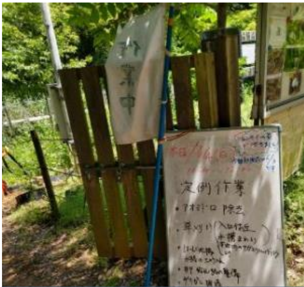
入口に掲示した作業中の掲示