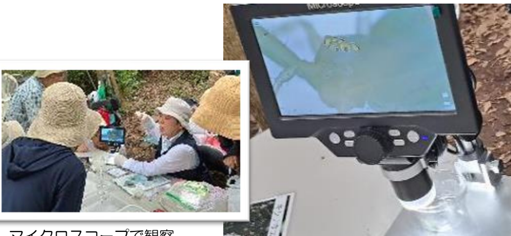
マイクروسコープで観察 クモの目の位置が種類によって異なること説明して下さっているところ。