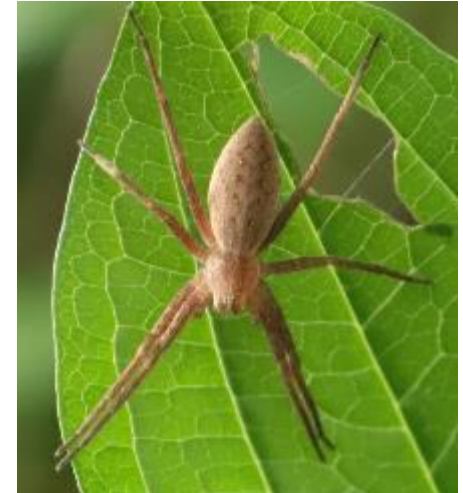
イオウイロハシリグモ