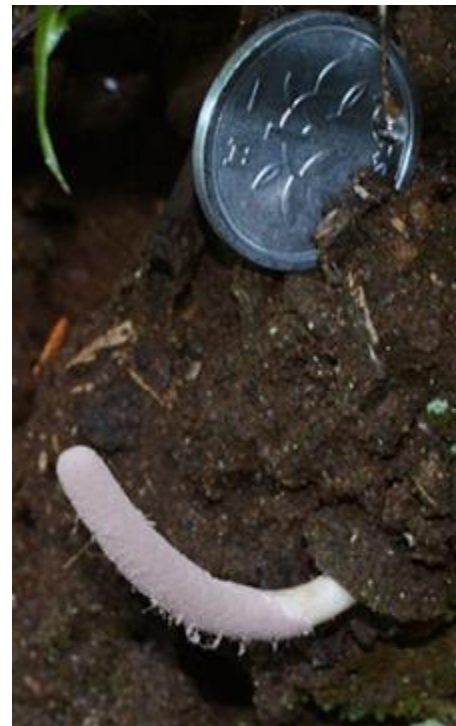
クモタケ キシノウエトタテグモの冬虫夏草