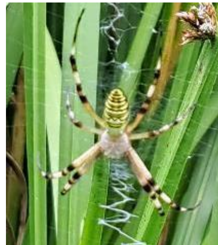
ナガコガネグモ 縦線の白い隠れ帯