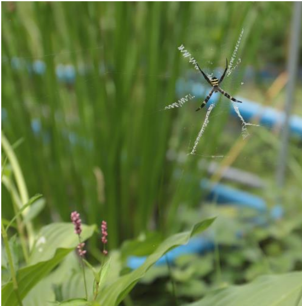
コガネグモ X字型の白い隠れ帯が特徴