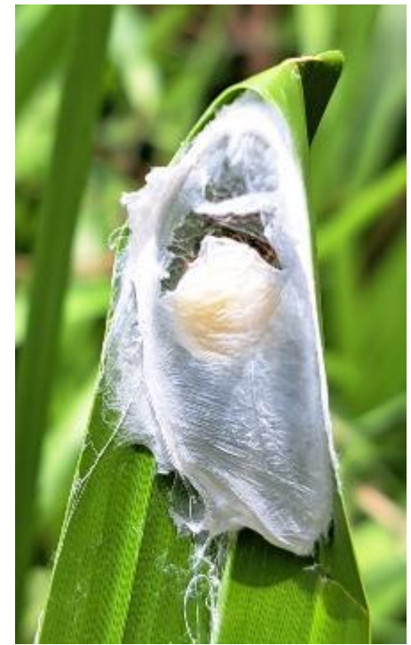
ヤマトコマチグモの卵のう