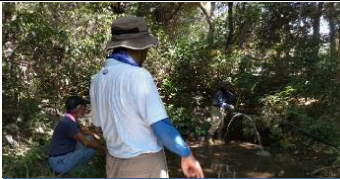
第一調整池最北端に入る給水を2分岐から3分岐にする作業