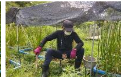
草刈り作業。特にナガエツルノゲイトウがはびこった本池北端と水槽群東側の地点を重点的に行なった。