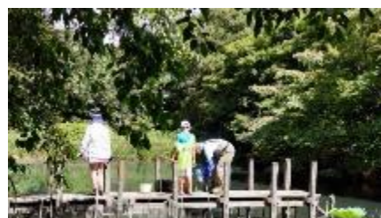
ザリガニ捕獲と生き物探し