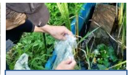
会員宅で育ったヒシを 第5水槽に移植