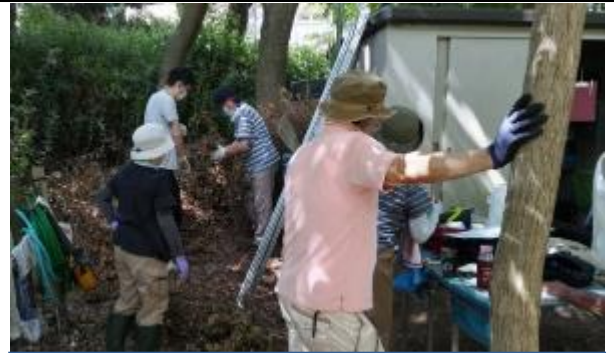
枝打ちしたウバメガシの枝を束ね、粗朶を作る作業