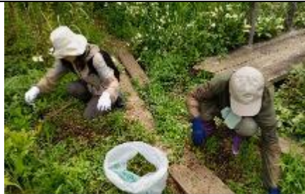
ナガエツルノゲイトウの駆除作業 水槽回り