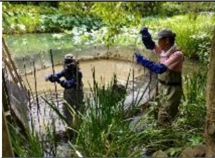
本池内での囲いの囲い位置修正作業