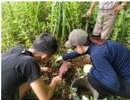
ホタルブクロの移植