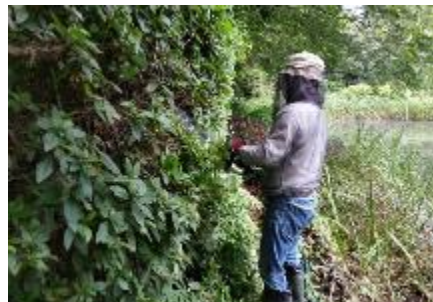
電動のこぎりを使用しての剪定作業 オオムラサキ