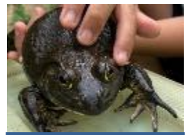
大きなウシガエルを 観察する