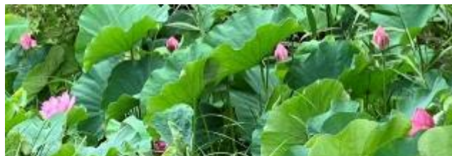
本池に咲き始めた古代ハス