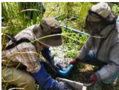
ジュンサイの株分け