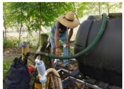
給水タンクの整備