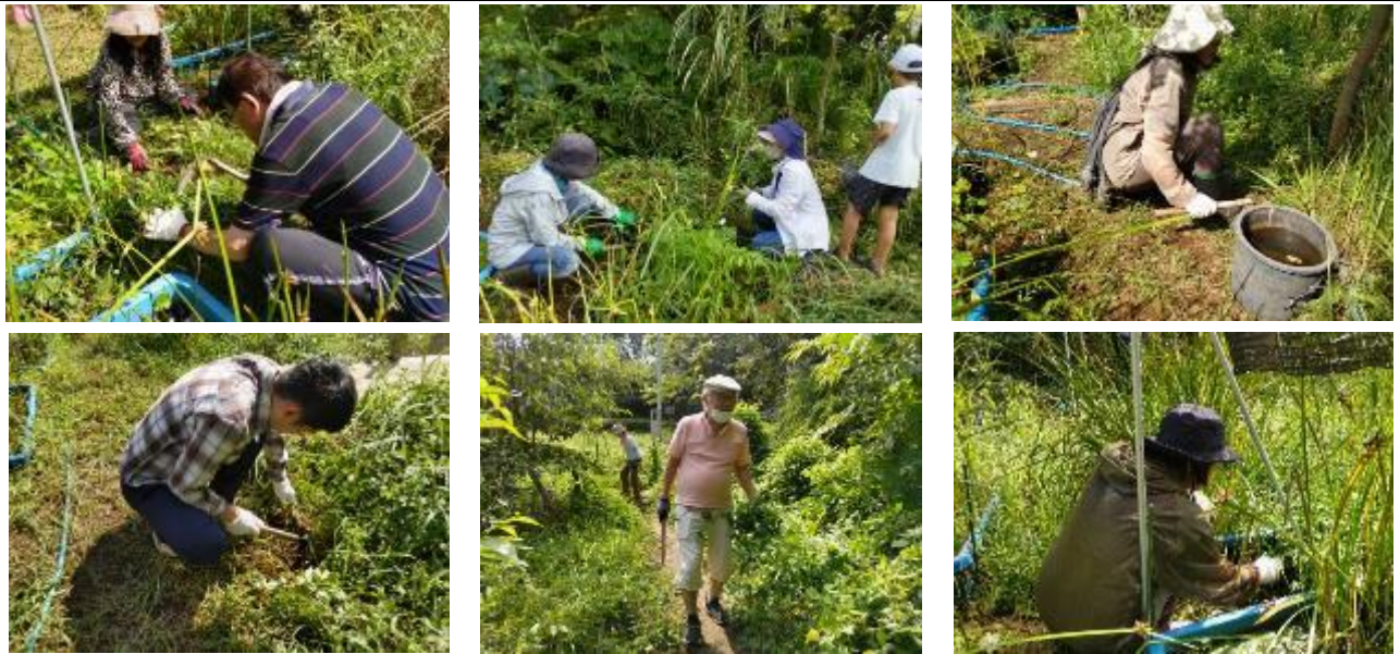
夏草刈りに精を出す参加者の皆さん、残暑厳しい中、お疲れさまでした！（上6枚）