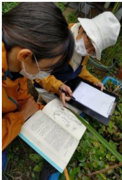
図鑑と会照らし合わせて、 水槽内の水草を確認する