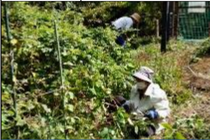
管理地入口付近の草刈り