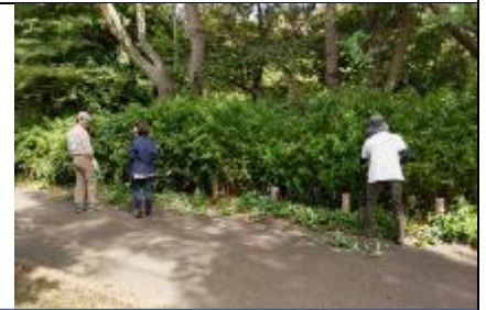
小学校側外周オカメザサの剪定