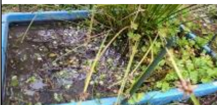
ジュンサイを約半分株分けした第8水槽