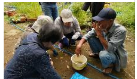
ザリガニ捕獲かごに入った 小魚類を学ぶ