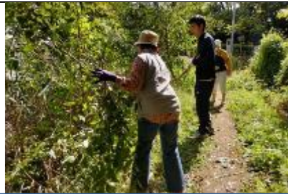
育成池端の樹木の枝切り