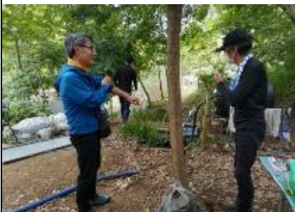
株分けしたジュンサイの交換と移動