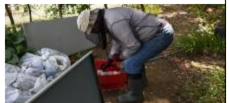
経年劣化が進んだ第3物置の扉の修理