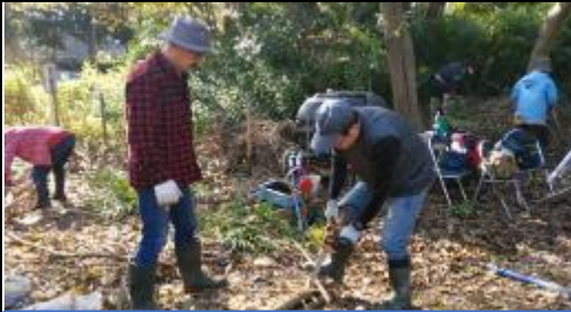
樹の枝をおろして、40 cm程度の長さに切り、まとめて縛ったものが粗朶