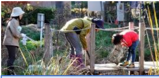
ザリガニ捕獲カゴの点検