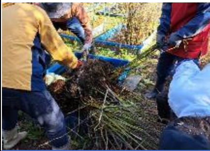
第2水槽に広がり過ぎたカンガレイは水槽いっぱい根を張っていた