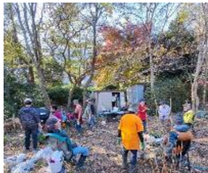
落ち葉ふる中の作業