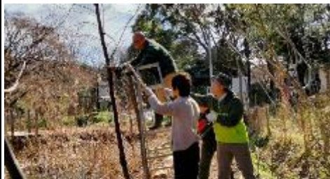
育成池回りの樹木の剪定