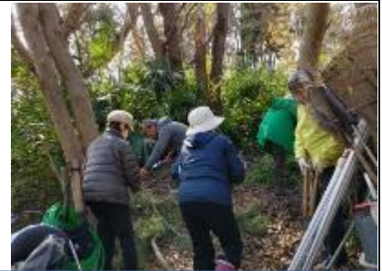
枯れ枝等を集め束ねての粗朶作り