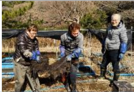
水槽の抽水植物の整理