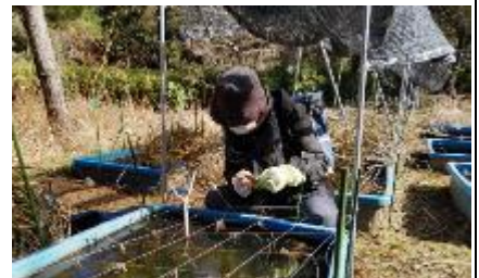
水槽内の水草調査