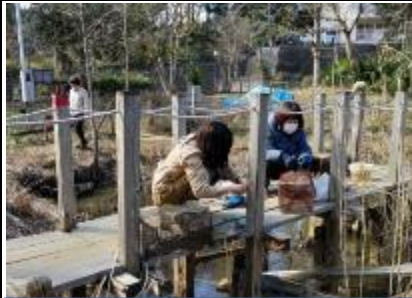
ザリガニ捕獲かごの点検と整備