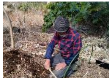
野草保護予定地の整備