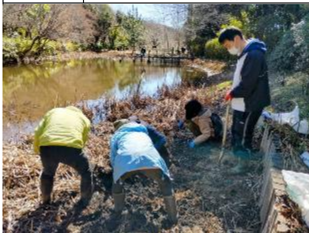
ナガエツルノゲイトウの除去作業