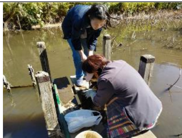
アメリカザリガニ捕獲かごの点検