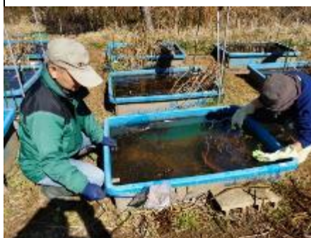
水槽内の枯れ葉整理と水草調査