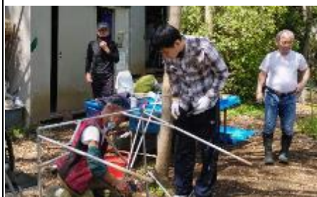
排水口ごみ取りネット枠を制作