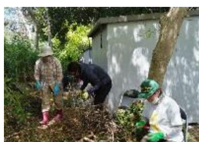
粗朶作り用の枝を整理