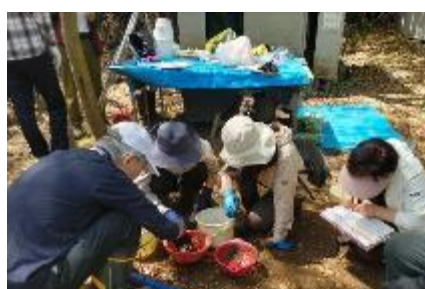
捕獲したザリガニ数を記録