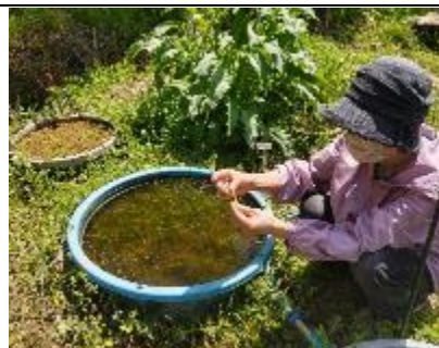
アカウキクサの除去