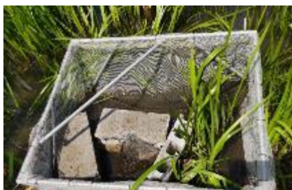
完成したごみ取りネット