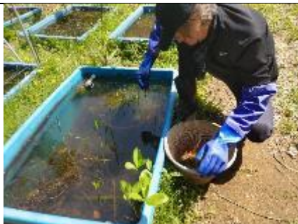
ヒシの実を水槽内に植え付け