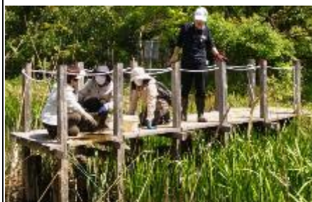
ザリガニ捕獲作業